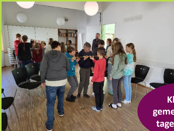
Klassen- gemeinschafts- tage Klasse 5

An der Horneckschule finden einige außerschulische Aktivitäten statt. Neben dem Wandertag und dem Jahresausflug, gibt es noch viele weitere Klassenstufenspezifische Aktivitäten: