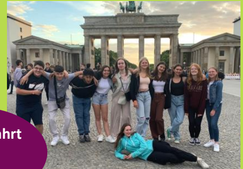
Abschlussfahrt Klasse 9 bzw. 10