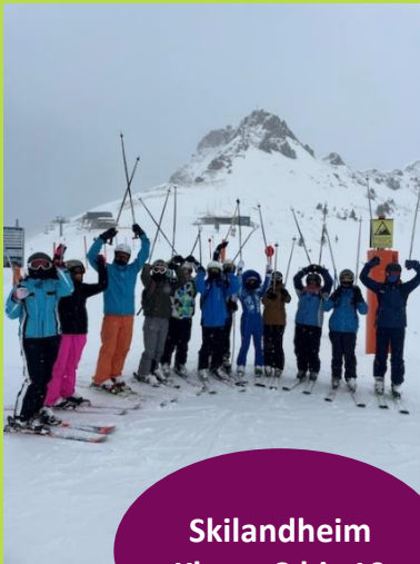
Skilandheim Klasse 8 bis 10