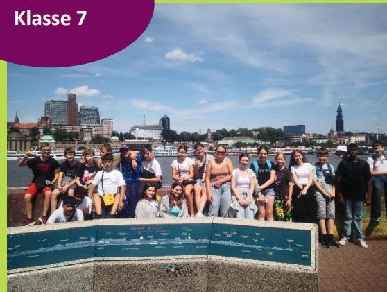
Schullandheim Klasse 7